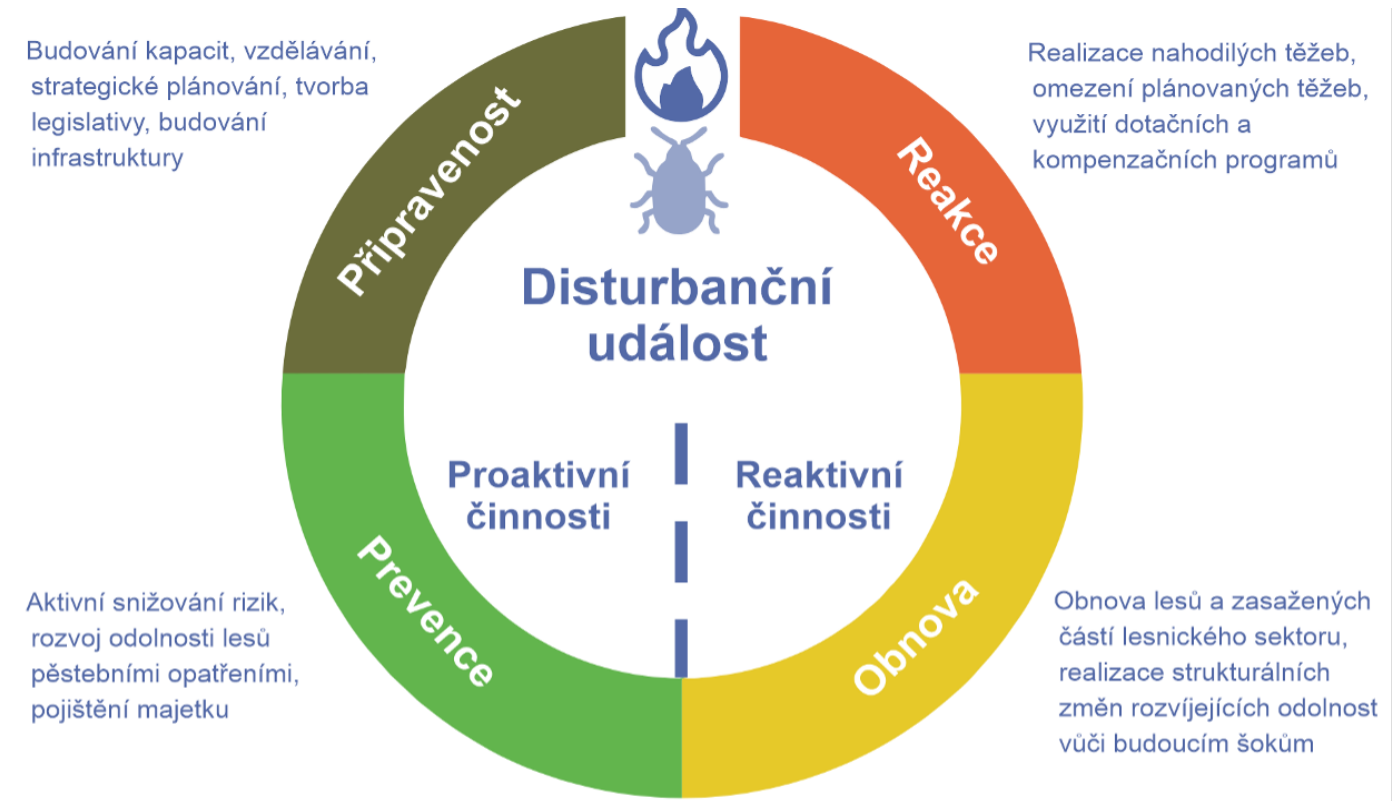
Obr. 1: Čtyři fáze cyklu pro management krizových situací. Upraveno podle Lindner, M. und Schuck, A. (2020). Towards holistic forest crisis management - adapting to changing disturbance regimes in Europe. EFI Policy Brief 08_2020. https://sure.efi.int/sites/default/files/2020-08/Policy%20Brief_Towards%20holistic%20forest%20crisis%20management.pdf

Tato příloha je aktualizovanou verzí materiálu publikovaném ve zprávě Život s kůrovcem: Dopady, výhledy a řešení (Hlásny et al., 2019) a následné vědecké studie Bark beetle outbreaks in Europe: State of knowledge and ways forward for management (Hlásny a kol., 2021). Pro přehlednost jsou opatření uspořádána podle čtyř fází cyklu krizového řízení: Přípravenost – Prevence – Reakce – Obnova. Tyto fáze nemusí probíhat postupně za sebou a jedno opatření může být uplatněno v různých fázích cyklu. Například opatření na obnovu po disturbancích mohou ovlivnit účinnost budoucích preventivních opatření. Sanitární těžby mohou být využity jak k prevenci přemnožení kůrovců, tak jako reakce na probíhající kalamitu, za účelem zmírnění ekonomických ztrát. Všechny fáze vyžadují vysokou úroveň připravenosti – a to jak z hlediska lidských a technických kapacit, tak i legislativy, zlepšeného vzdělávání a školení, mezioborových krizových plánů a dalších aspektů.